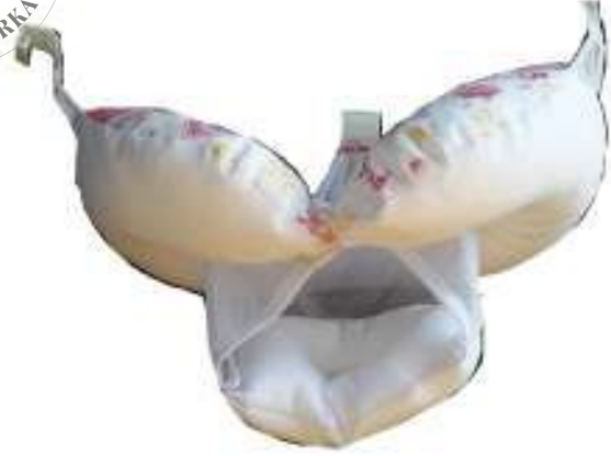
1.1 File Yapılı Küvet çi Yıkama Koltu u