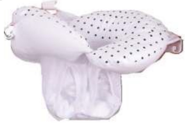
2.1 File Yapılı Küvet çi Yıkama Koltu u