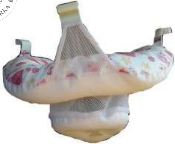
1.3 File Yapılı Küvet çi Yıkama Koltu u