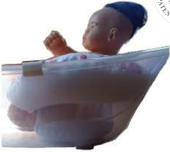
1.5 File Yapılı Küvet için Yıkama Koltuğu