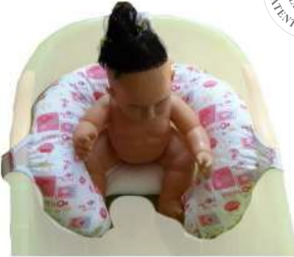
1.7 File Yapılı Küvet için Yıkama Koltuğu