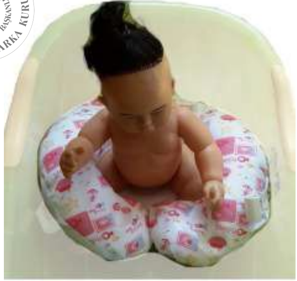
1.6 File Yapılı Küvet için Yıkama Koltuğu