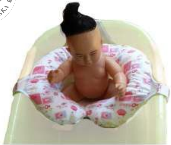
1.8 File Yapılı Küvet için Yıkama Koltuğu